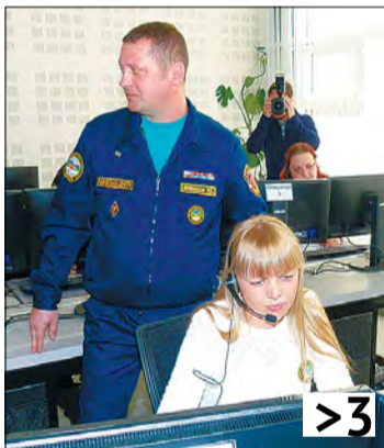
«Система-112» готовится к запуску