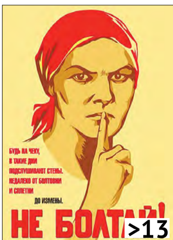
Лишние разговоры приводят... на скамью подсудимых