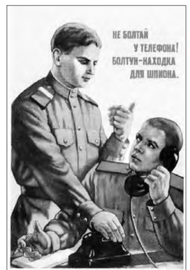
В воинской части ЮЯ-19134 неплохо бы развесить старые советские плакаты...